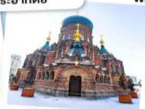
โบสถ์เซนต์ไอแซค