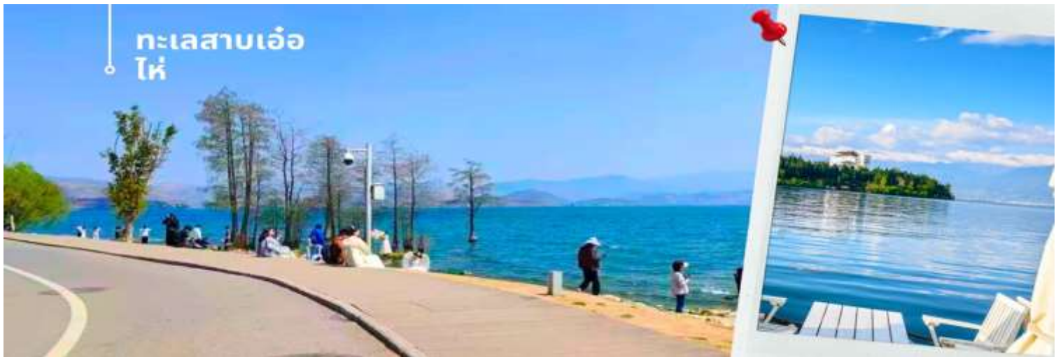
ทะเลสาบเอ๋อไห่

จากแม่น้ำหุ่ยหลาน ให้เข้าสู่ทะเลสาบเตียนซี น้ำตกแห่งนี้มีความสูง 12.5 เมตร ยาว 400 เมตร ใช้เวลาสร้างเกือบ 3 ปี 📍 รับประทานอาหารกลางวันที่ภัตตาคาร (2) เมนูพิเศษ!! ขนมหุ้นข้ามสะพาน นำท่านเดินทางสู่ เมืองต้าหลี่ (ใช้เวลาในการเดินทางประมาณ 4 ชั่วโมง) นำท่านเดินทางแวะชม ทะเลสาบเอ๋อไห่ ทะเลสาบเอ๋อไห่มีพื้นที่ตั้งอยู่บนที่ราบสูงในเมือง ต้าหลี่ มีความยาวจากทิศเหนือจรดทิศใต้ราว 20 กิโลเมตร และความกว้างประมาณ 9 กิโลเมตร เป็นทะเลสาบที่ใหญ่เป็นอันดับสองของประเทศจีน ทะเลสาบแห่งนี้มีความสำคัญอย่างมากกับชาวเมืองมาตั้งแต่อดีต เป็นทะเลสาบที่หล่อเลี้ยงชาวบ้านชาวเมือง แต่ในปัจจุบันถึงแม้ว่าความสำคัญดังเช่นในอดีตจะเลือนหายไป แต่ทะเลสาบแห่งนี้ยังคงเป็นที่ท่องเที่ยวพักผ่อนแก่นักท่องเที่ยว ให้ท่านได้ชมวิทิวทัศน์ที่สวยงาม