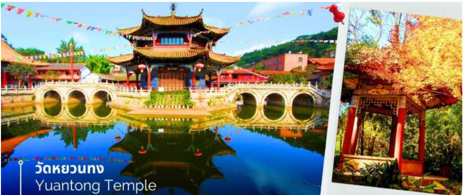
วัดหยวนทง Yuantong Temple

นำท่านชม วัดหยวนทง (Yuantong Temple) วัดแห่งนี้เป็นวัดที่ใหญ่และเก่าแก่ที่สุดในเมืองคุนหมิง สร้างมาตั้งแต่สมัยราชวงศ์ถัง มีอายุยาวนานประมาณ 1,200 กว่าปี การสร้างวัดแห่งนี้จะแปลกตากว่าวัดอื่นในจีน เพราะปกติแล้วการสร้างวัดของจีนส่วนมากจะต้องสร้างอยู่บนภูเขา แต่วัดหยวนทงสร้างวัดต่ำกว่าภูเขา โดยวิหารจะอยู่ต่ำที่สุด เนื่องจากวัดแห่งนี้ไม่ได้สร้างขึ้นเพื่อเป็นวัดโดยตรง แต่เคยเป็นศาลเจ้าแม่กวนอิมมาก่อน