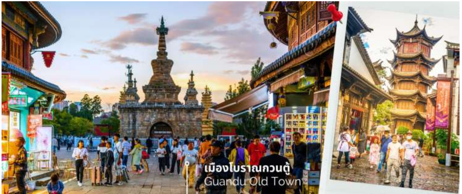
เมืองโบราณกวนตุ๋ Guandu Old Town

นำท่านชมบรรยากาศ เมืองโบราณกวนตุ๋ (Guandu Old Town) เป็นหนึ่งในต้นกำเนิดของวัฒนธรรมยูนนาน และยังเป็น ถือเป็นหนึ่งในภูมิทัศน์ทางประวัติศาสตร์และวัฒนธรรม ที่สำคัญของเมืองคุนหมิง เมืองโบราณแห่งนี้ยังคงเคยเป็น ศูนย์กลางทางการค้าและคมนาคมที่สำคัญ ในอดีตเคยเป็นหมู่บ้านชาวประมงในสมัยราชวงศ์ถัง เมืองกวนตุ๋ยังเป็นเมือง แรกๆ ที่ศาสนาพุทธทางไนทิเบตได้เริ่มเผยแผ่เข้ามาในดินแดนยูนนาน