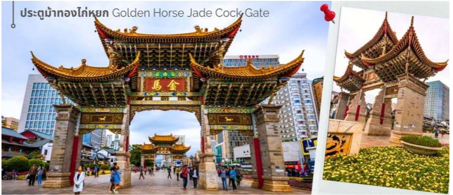
ประตูม้าทองไก่อหยก Golden Horse Jade Cock Gate

ชม ซุ้มประตูม้าทอง และ ซุ้มประตูไก่อหยก ซึ่งภาษาจีนเรียกว่าจินหม่า และปี้จี จิ้งเอาค่าย่อ จินปี้ มาชานานนามถนน แห่งนี้ ซุ้มม้าทองและไก่อหยก มีอายุร่วม 400 ปี สร้างขึ้นในสมัยราชวงศ์หมิง ในถนนย่านการค้าแห่งนี้ เป็นแหล่งเสื้อผ้า แบรนด์เนมทั้งของจีนและต่างประเทศ รวมทั้งเครื่องประดับ อัญมณี ร้านเครื่องดื่ม และร้านขายของที่ระลึกมากมาย