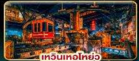
เทวินเทอไฮเวย์