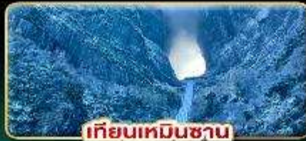
เทียนเหมินซาน