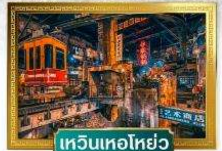
เหวินเหอโฮ่ย