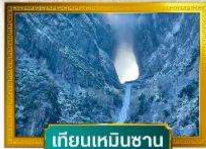
เทียนเหมินซาน