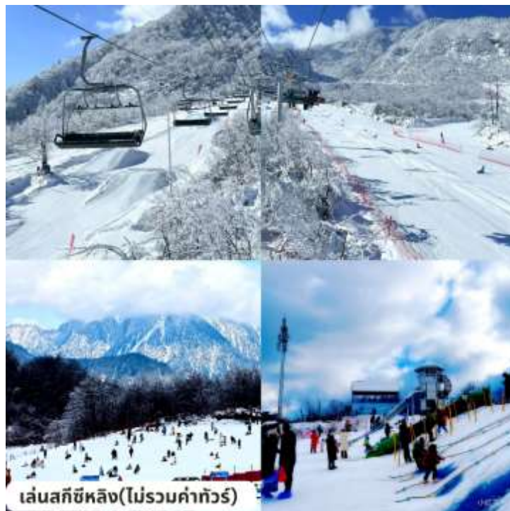
เล่นสกีซีหลิง(ไม่รวมค่าทัวร์)

นำท่านหนึ่งกระเช้าสู่ภูเขาหิมะซีหลิง (รวมกระเช้าขาขึ้น-ขาลง) เพื่อชมวิวิวทิวทัศน์บนยอดเขาซีหลิง “ชมวิวิวเขาสุริยัน จันทรา” บนระดับความสูง 3,250 เมตร เป็นจุดชมวิวิวบนยอดเขาซีหลิง ทุกปีในฤดูหนาวบนยอดเขาแห่งนี้กลายเป็นทุ่งหิมะหนาปกคลุมไปทั้งเขา เชิญท่านถ่ายภาพเก็บความประทับใจเป็นที่ระลึก จากนั้นให้ท่านได้อิสระเพลิดเพลินกับกิจกรรมต่างๆ บนลานหิมะซึ่งมีความหนาประมาณ 60-100 เซนติเมตร สถานที่แห่งนี้พร้อมไปด้วยอุปกรณ์ การเล่นบนลานหิมะที่หลากหลาย เช่นกิจกรรม แพนเลื่อนหิมะ สกีหิมะ ม้าลากเลื่อนหิมะ บอลลูน สโนว์โมบิล เครื่องเล่นสไลด์และอื่นๆอีกมากมาย (ราคาทัวร์ไม่รวมค่าเช่าอุปกรณ์ ค่าเครื่องเล่นต่างๆ และค่าครุฝึกในการเล่นสกี)