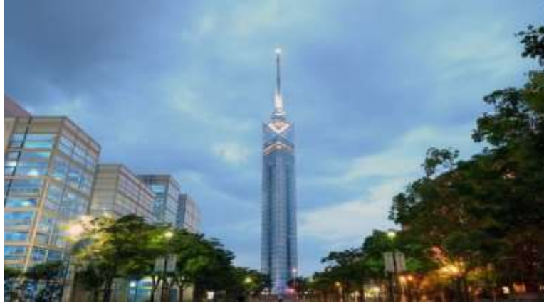
Fukuoka Tower หอคอยตติงทศที่สูงที่สุดในประเทศญี่ปุ่นถึง 234 เมตร

สถานที่ท่องเที่ยวที่ได้รับความนิยมมากที่สุดในฟูกูโอกะ: