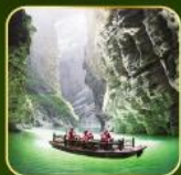
ล่องเรือแม่น้ำไตตั้นกูอู๋