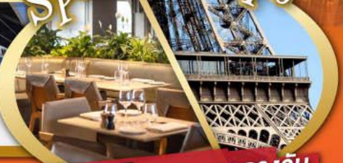
รับประทานอาหารกลางวันบนหอไอเฟล