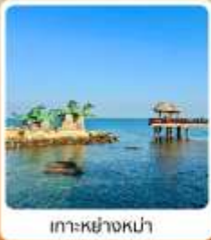
เกาะหย่างหม่า

ไฮไลท์...เที่ยวแดนมังกรฟิลยุโรป เมืองชายฝั่งทะเลเหลือง ชมสะพานจันเจียว และพิพิธภัณฑ์เบียร์