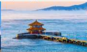
สะพานจันเจียว