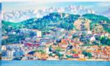
หมู่บ้านชาวประมงซาจื่อโซ่ว