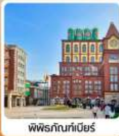
พิพิธภัณฑ์เบียร์