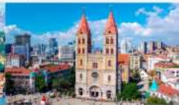
โบสถ์คริสต์เซนต์ไมเคิล

*ทางบริษัทฯ ขอสงวนสิทธิ์ในการสลับโปรแกรมทัวร์ตามความเหมาะสมขึ้นอยู่กับสถานการณ์หน้างาน โดยคำนึงถึงผลประโยชน์ของลูกค้าเป็นสำคัญ