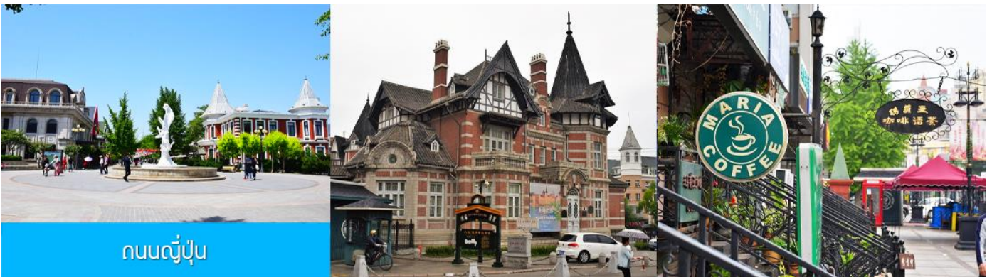
ถนนญี่ปุ่น