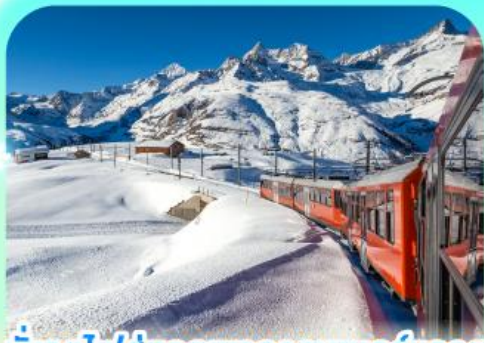
นั่งรถไฟสู่ยอดเขารอนเนอร์แตร