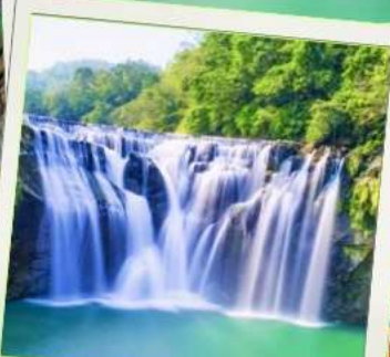
น้ำตกซือเฟิ่น