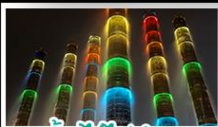
น้ำพุไม้ไผ่ตักSKP