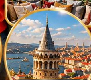
หอคอยกาลาตา Galata Tower