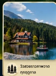
วิวสวยราวภาพวาด ทุกฤดูกาล