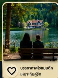
บรรยากาศโรแมนติก เหมาะกับการคู่รัก