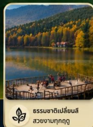
ธรรมชาติที่สวยงาม สวยงามทุกฤดู