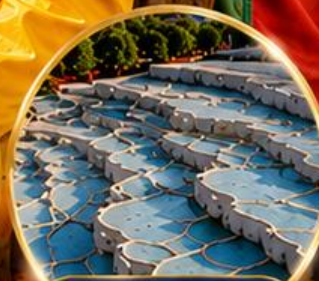
ปามุกคาล่า Pamukkale