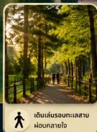
เดินเล่นรอบทะเลสาบ ผ่อนคลายใจ

จุดหมายยอดนิยมของนักท่องเที่ยว สำหรับการพักผ่อนและใกล้ชิดธรรมชาติ