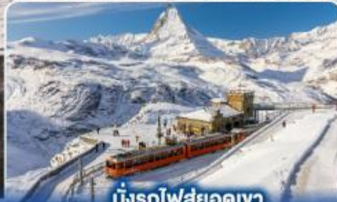
นั่งรถไฟสู่ยอดเขา กรอนเนอร์เกรต