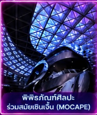
พิพิธภัณฑ์ศิลปะร่วมสมัยเซินเจิ้น (MOCAPE)