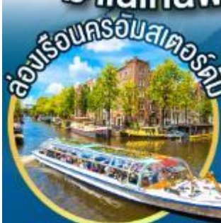
ล่องเรือชมเมืองแห่งสายน้ำ นครอัมสเตอร์ดัม