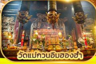
วัดแม่กวนอิมของฮ่า