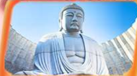
เดินชมพระพุทธรเจ้า