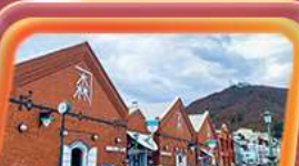
ท่องฮอกไกโด