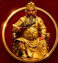
ขอพรเทพเจ้ากวนอู

เปิดดวงเศรษฐี เสริมดวงจួយที่ไต้หวัน ขอพรเทพกวนอู รับพลังบารมีเจ้าแม่มาจู่ 4 วัน 3 คืน