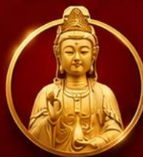
รับพลังบารมีเจ้าแม่มาจู่