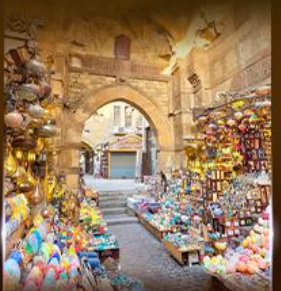
ตลาดงานเวอคาเลีย