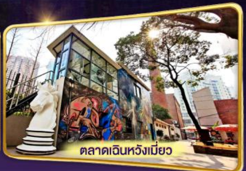
ตลาดเดินหวังเมี่ยว