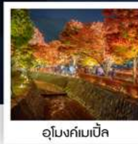
อุโมงค์เมบีส