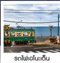
รถไฟโอบุเอะดิน