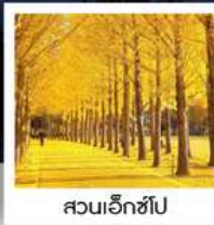
สวนเอ็กซ์โป