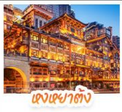
ตึกเซาตง

สัมผัสใบไม้แดงสุดงดงามที่ ภูเขาหมื่นชางชาน และ ภูเขาทงอู่ชาน ชมวิวกลางคืนสุดอลังการที่ หงหยาดัง แลนด์มาร์กชื่อดังแห่งฉางชิ่ง สักการะพระโพธิสัตว์เจ้าแม่กวนอิม ณ วัดหลิงฉวน ขอพรเสริมสิริมงคล ช้อปปิ้งแลนด์มาร์กสุดฮิต แพนด้าปิ่นตึก IFS + POP MART ช้อปปิ้งจุใจที่ ไถ่กู่หลี่ ถนนคนเดินชุมชน