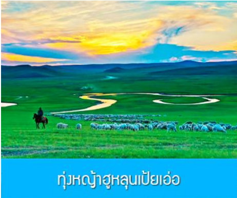
ทุ่งหญ้าฮูลุนเปี้ยเอ๋อ