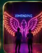
จุดเช็คอินสุดฮิต