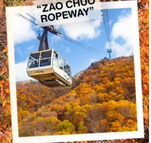
"ZAO CHUO ROPEWAY"

วันเดินทาง 30 ต.ค. - 5 พ.ย. 2569 4 - 10 พ.ย. 2569