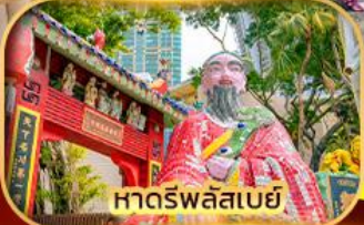
หาดรพลัสเบย์