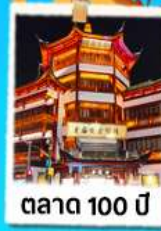
ตลาด 100 ปี