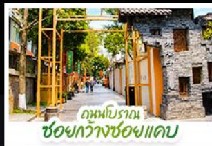
ถนนโบราณ ซอยกว้างซอยแคบ