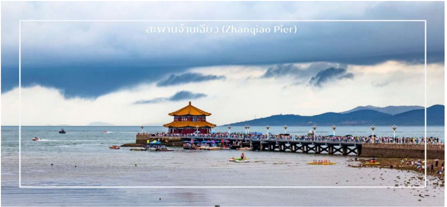
สะพานฉานเจียว (Zhanqiao Pier)