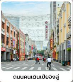
ถนนคนเดินเป่ย์จิงลู่