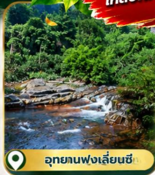
อุทยานฟงเหลียนซี