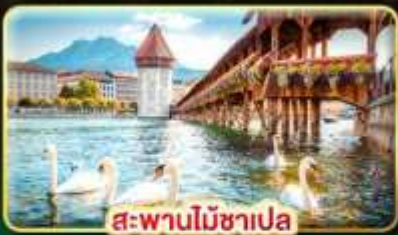
สะพานไม้อาเปลา