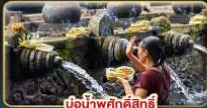
บ่อน้ำพุศักดิ์สิทธิ์