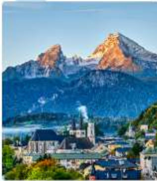
ออสเตรียบาวาเรียดินแดนแห่งเทพนิยาย