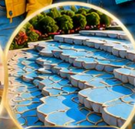
ปามุกคาล์ Pamukkale