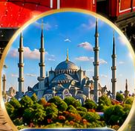
สุเหร่าสีน้ำเงิน Blue Mosque