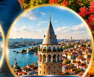
หอคอยกาลาตา Galata Tower