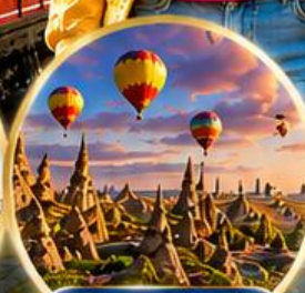
เมืองคัปปาโดเกีย Cappadocia