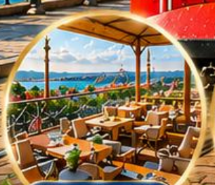
Seven Hills Cafe ชมวิว อิสตันบูล